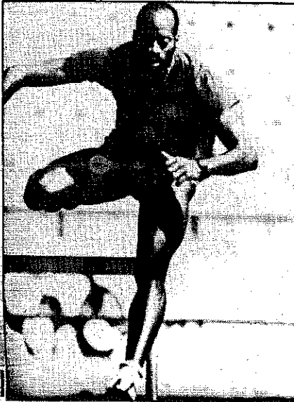
Moses se habrá de emplear a fondo