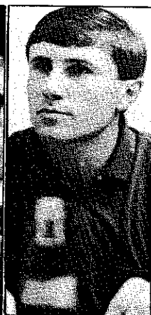
Reynolds y Bubka, dos recordistas en acción

realizado agote todas las reservas energéticas del organismo. La mayor parte de la energía se obtiene anaeróbicamente, es decir, sin presencia de oxígeno. Estas dificultades que representan la